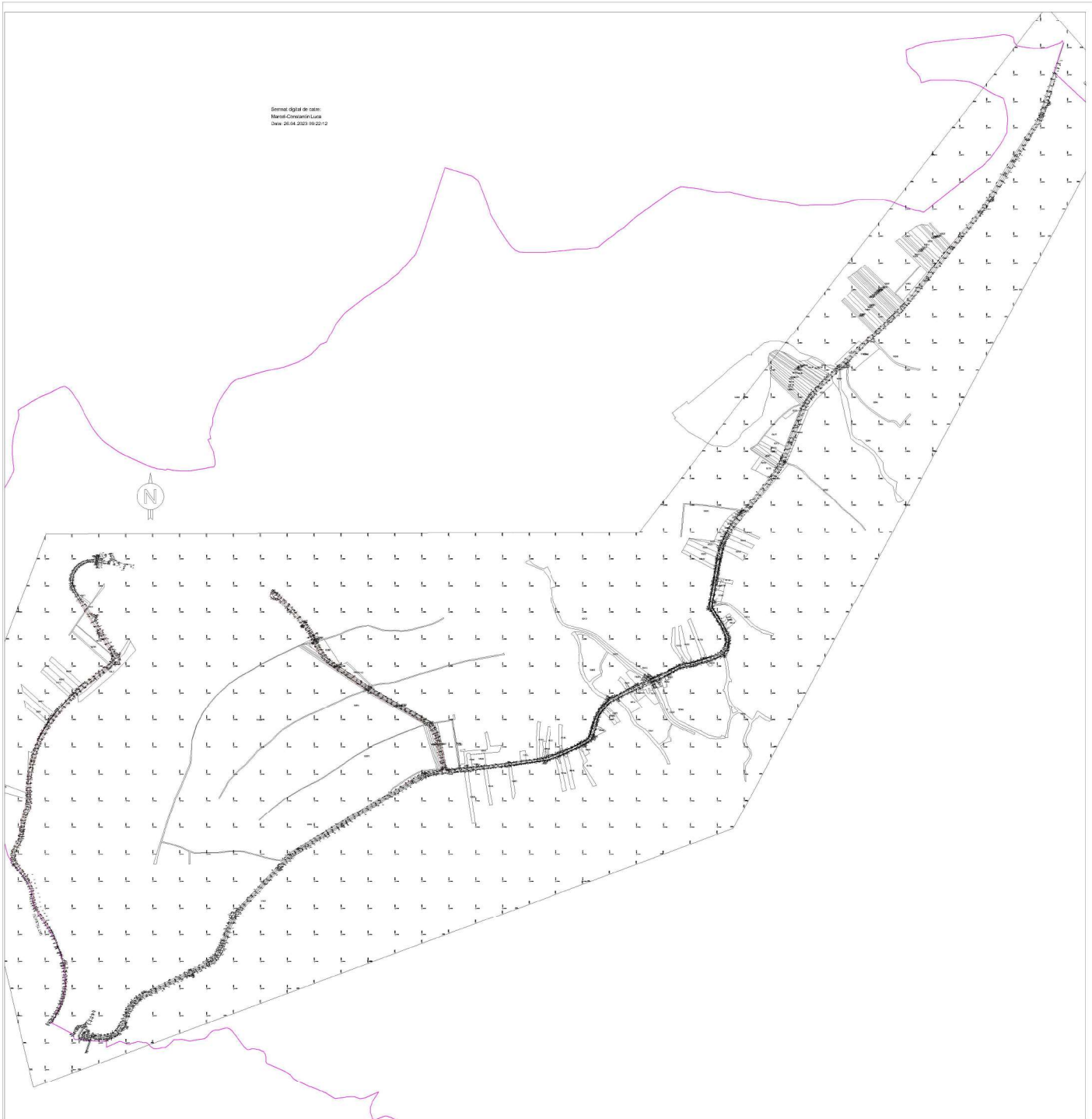
PLAN PESPURT TOPOGRAFIC sc.1:5000

Detaliat digital de către: Marius Ciocanăși Luciu Data: 26.04.2023 09:22:12